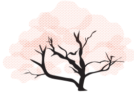
Aclareo de copa