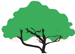
Levantamiento de copa