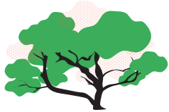
Reducción de copa