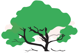
Limpeza de copa (ramas enfermas o quebradas)